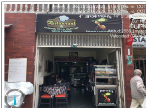
Fotografía No. 1. Publicidad establecimiento de comercio Restaurante la Martuja