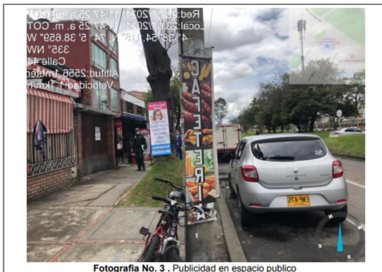
Fotografía No. 3 . Publicidad en espacio publico