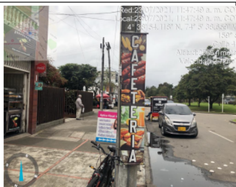
Fotografía No. 2 . Publicidad en espacio publico